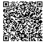
オンライン受付システム

詳しいお申込み方法は別紙「オンライン受付システム操作方法」をご覧ください。「オンライン受付システム」は財団ホームページからもアクセスしていただけます。