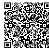
オンライン受付システム

・申込は、「オンライン受付システム」にログインし、 施設・事業所毎 にお申込みください。 詳しいお申込み方法は別紙「オンライン受付システム操作方法」をご覧ください。「オンライン受付システム」は財団ホームページからもアクセスしていただけます。