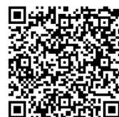
財団ホームページ

お申込み後、視聴用のパスワード等をメールにてお送りいたします。なお、視聴用のパスワード等を施設・事業所内で共有いただければ、どなたでも御視聴いただくことが可能です。