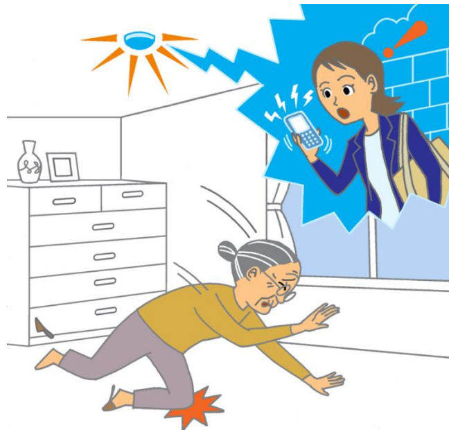
重点分野のイメージ

「ロボット介護機器開発・導入促進事業(開発補助事業)研究基本計画」 (経済産業省 製造産業局 産業機械課(平成29年10月)) <抜粋>