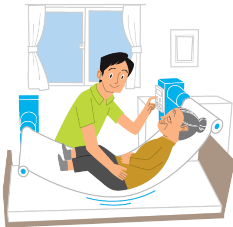
重点分野のイメージ

「ロボット介護機器開発・導入促進事業（開発補助事業）研究基本計画」 （経済産業省 製造産業局 産業機械課（平成29年10月））<抜粋>