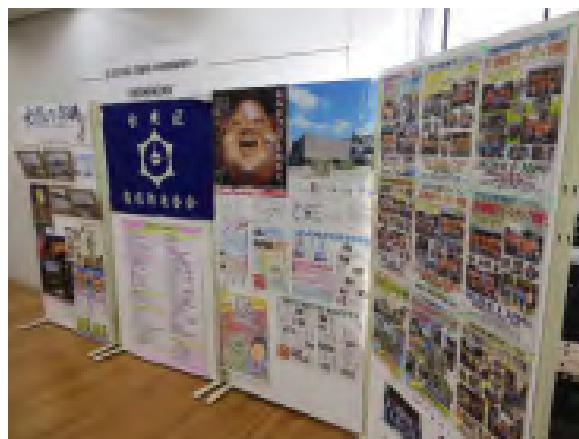
台東区商店街連合会のブース。クリーンアップ作戦の取組を紹介していただきました。