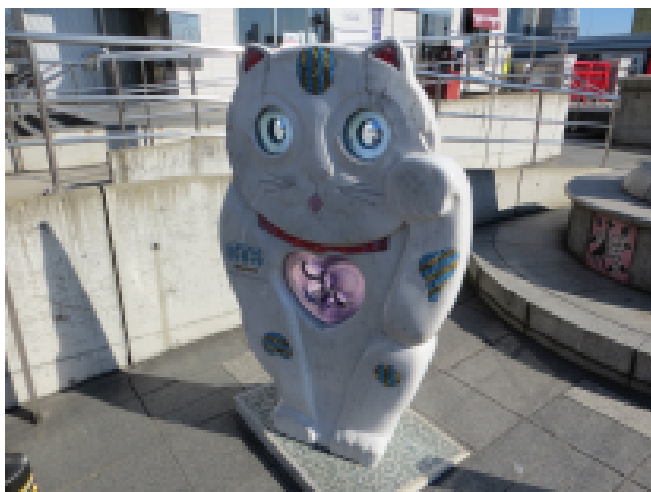
可愛らしい招き猫「そらちゃん」

「スカルプチャーツリー」での様子。中に十二支が取り付けられていて、参加者は「自分のは、どれかな？」と楽しげに探していました。